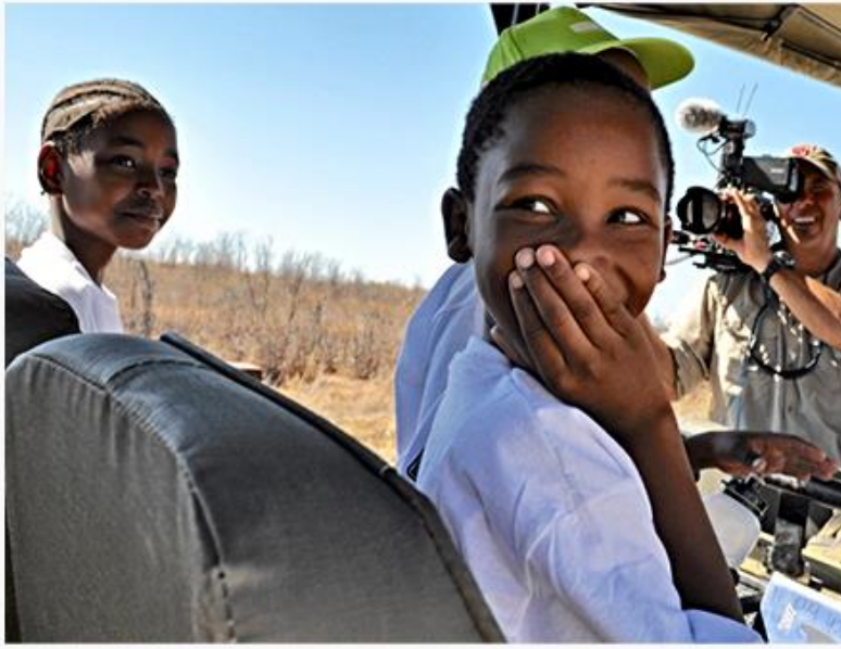
Pour la première fois, ces enfants ont pu observer un éléphant !

Nous emmenons parfois des classes d'enfants visiter le Delta de l'Okavango. Ils peuvent y admirer lions, lycaons, léopards, hyènes, éléphants... Plus de 80 % de ces enfants n'ont jamais vu ces animaux auparavant alors qu'ils habitent à proximité immédiate de ces espaces de vie sauvage qui sont parmi les plus beaux du Monde.