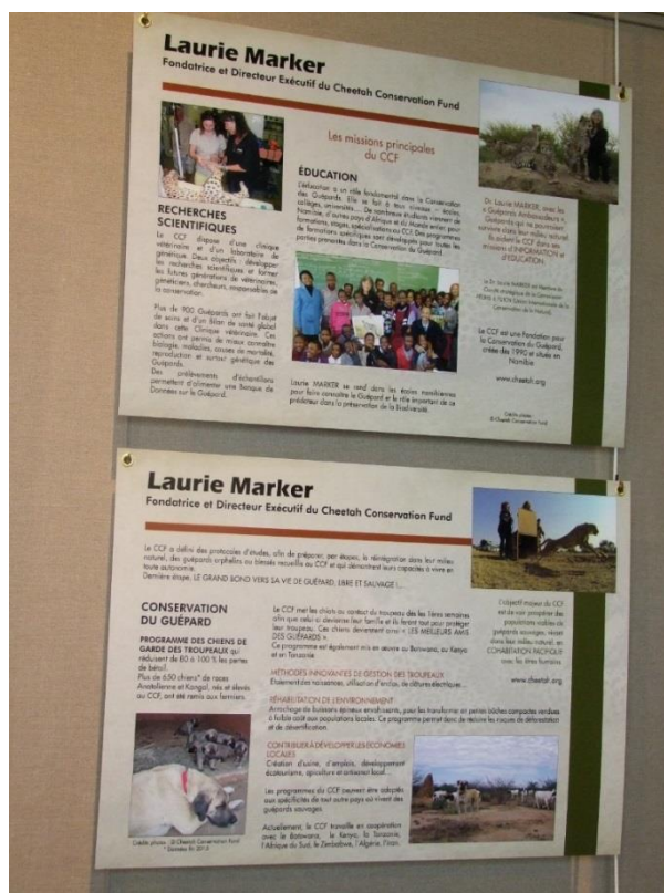
Programmes d’actions du CCF – Recherches, Education, Conservation