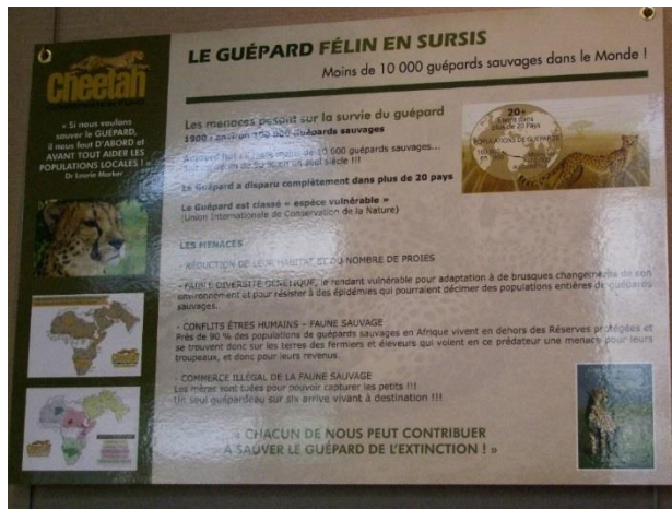
Panneau “COURSE POUR LA SURVIE” – moins de 10 000 guépards sauvages dans le Monde, et les 2 cartes montrant les différences de territoires entre 1900 et aujourd’hui. Ces images se révèlent un choc pour le Public ! Ceci confirme que les Images valent mieux qu’un long discours...